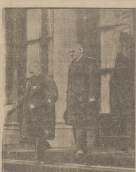
Paryz w krytycznych dniach. Na ilustracji widzimy oddział wojska wkraczającego na podwórze ministerstwa spraw wewnętrznych sprowadzony z posterunku zamkniętego w mieście podczas rozruchów oraz premiera Gastona Doumergue opuszczającego pałac elizejski po rozmowie z prezydentem Lebrun.