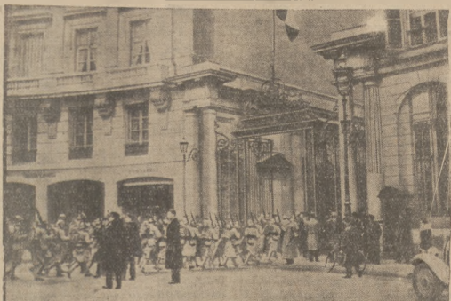
Paryz w krytycznych dniach. Na ilustracji widzimy oddział wojska wkraczającego na podwórze ministerstwa spraw wewnętrznych sprowadzony z posterunku zamkniętego w mieście podczas rozruchów oraz premiera Gastona Doumergue opuszczającego pałac elizejski po rozmowie z prezydentem Lebrun.

Opłata poczt. ulaz crena ryczałtem. | ROK XXV | Niedziela 11 lutego 1934 roku. | Nr. 41. Adres Redakcji i Administracji: Sosnowiec, Piłsudskiego 4. Telefon: Red. 64, Adm. 73. | P.K.O. 302.712 | Redaktor naczelny przyjmuje od godz. 11 — 1 i od 6 — 7. Rękopisy redakcja nie zwraca.