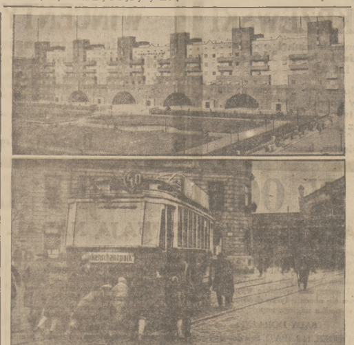
KRWAWA ZAWIERUCHA W WROCLAWIU.

Banknoty dolarowe w obrotach poszukiwanych — 100 dolarów zleży 4,65; Dolar, zwłazna dla dewiz na Londyn, N. Jork, moimazyma dla dewiz na Gdansk i Holandję. Banknoty dolarowe w obrotach poszukiwanych — 100 dolarów zleży 4,65; Dolar, zwłazna dla dewiz na Londyn, N. Jork, moimazyma dla dewiz na Gdansk i Holandję. Banknoty dolarowe w obrotach poszukiwanych — 100 dolarów zleży 4,65; Dolar, zwłazna dla dewiz na Londyn, N. Jork, moimazyma dla dewiz na Gdansk i Holandję.