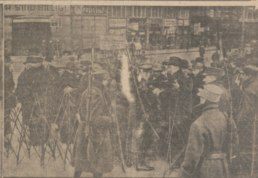
KRWAWE DNI WIEDNIA.

Żołnierze austriacki na posterunku z karabinem maszynowym. Zaseka ścieżki kołczastych na ulicach Wiednia: posterunki sprawdzają przepuski i rewidują czy broń kto nie ma.