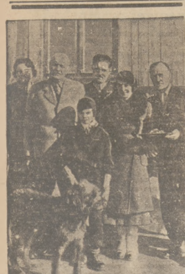
PREZDENT RP IŻELI W ZAKOPANEM. Stańd od lewej: sta pała Prezydenta, siostrzeńca Prezydenta, córka odwołania p. Bobasowa i ministerstwo Bolesława

Kursy ustalono na podstawie cen giełdowych. Zółc Jednostki 700 g. od 14.07 do 14.75, tyto zbiranie 577 g. bez obrót. Pieniężna Jednostka 740 g. 20.90—21. Pieniężna zbirana 17.00 g. 20.00—20.50. Obrót jednolity 468 g. 17.00—12.00. Owies zbirany 438 g. 20.50—11.00. Jęczmień koronny 652 g. 13.75—14.00. Jęczmień browarny 664 g. bez obrót 15.00—15.50. Ziemniaki fabryczne 4.00—4.25. Mak mielniczy z wodzikiem 50.00—55.00. Mak sewna nr. 1, 4.44. Pieniężna 54.00—56.00. Mak przerna gal. I 65/4 50.00—54.00. Mak przerna gal. II 50/4 po likwidacji 17.00—23.00. Mak żytni I gal. II do 25/4 24.00—25.00. Mak żytni I gal. II do 65/4 24.00—25.00. Mak żytni I gal. II do 55/4 25.00. Mak żytni II gal. I do 16.00—19.00. Mak żytni II gal. I do 16.00—19.00. Mak żytni II gal. I do 12.00—13.00.