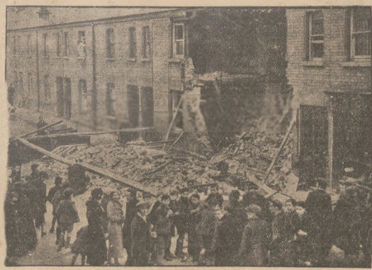
TEROR W IRLANDJI. — W Irlandji znowu doszło do groźnych rozruchów, zwrotnych przeciw „niebieskim kolczym” generała O'Duffy'ego. W czasie manifestacji zużyczo w miasteczku Dundalk bombę, która zniszczyła jedną z domów, paroczny 70-letnia starszyska i jej matę. Wszak odnosiły ciężkie rany.

SOSNOWICZ: Redakcja: Piłsudskiego 4. Tel. 74. Wydawca i REDAKTOR NACZ. WILHELM ARNOLD . — DRUK „KAMIERA ZACHODNI” w SOSNOWICU, PIŁSUDSKIEGO 4.