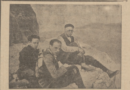
Znany krytyk Belgii był znakiem alpinista. Oto scena z jednej jego wycieczek górskich

zewnętrznym państwa; nie może udzielać pomocy prawnej stronie porażycy w sprawie prze- ciwko skanawij państwa; nie może pełnić obowiązków rady prawnej osoby fizycznej lub praw- nej ani członka władz w instytucji lub przedsiębiorstwa, gdy działal- ność danej osoby, instytucji lub przedsiębiorstwa polega wyłącznie lub przeważnie na słusznkach umow- nych lub finansowych ze skarbem państwa. Adwokat, sprawujący mandat sa- morządowy, nie może udzielać po- mocy prawnej przeciwko jednemu sa- morządowi, przez niego reprezento- wany, ani występować w zastępstwie klientów wobec organów tejże jedno- stki samorządowej.