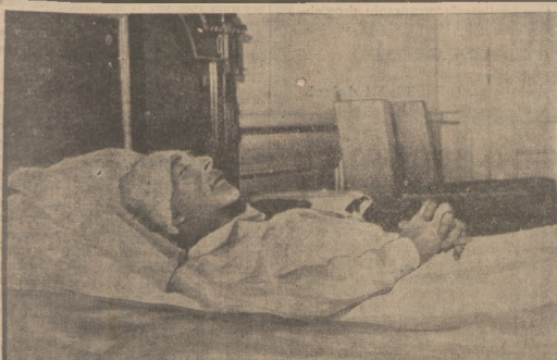
Zdjęcie króla Alberta na łożu w zamku Leseken. Złamana głowa epowita została bandażem. Na prawo: królewski pałac w Brukseli, przed którym wydawione były zwłoki na widok publiczny.

Redaktor naczelny przyjmuje od godz. 11 — 1 i od 6 — 7. Rękopisy redakcja nie zwraca.