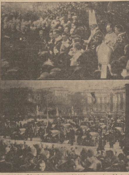
U góry: 1) minister Schunzbürg, 2) nowy wiedeński komisarz miasta Schmetz, 3) kanclerz Dollfuss, 4) prezydent republiki Miklas, 5) kandydat Imtizer. U dołu samochody ze zwłokami poległych.