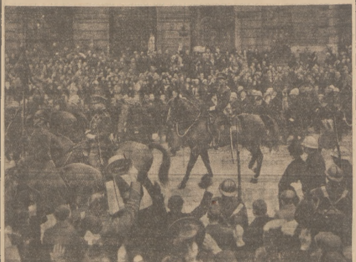
BRUKSELA WITA NOWEGO KRÓLA BELGII.

Wszystko to są cele piękne i polityczne. Ale takie rozdzielnie funduszu pracy na patumilione pozycje nie wiele dokona w każdej z wymienionych dziedzin. Natomiast skupienie grosu funduszu na odcinku drogowym, niewątpliwie dzisiaj najwazniejszym, załatwiłoby w ostatecznym stopniu przyznaniej jedną bolejącą.