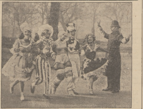
PANTOMINA W HYDE-PARKU.