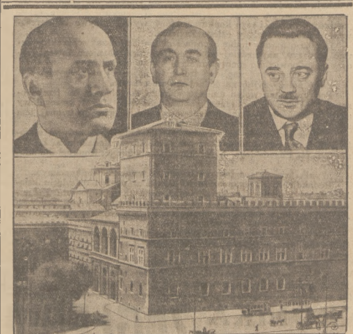
PRZED SPOTKANIEM W RZYMIE. Dnia 12 marca nastąpi w Rzymie spotkanie (od lewej) Mussoliniego, premiera włoskiego Gombiżera i kanclerza Deltunsa. Ponadto Palazzo Venezia w Rzymie, gdzie toczy się będą obrady trzech moców stanu.

Narazie plan amerykański zawiera tylko ogólne ramy, dopiero skutki praktyczne okażą jego wartość. W każdym razie skonstruowany jest w sposób logiczny i celowy, a dalsze jego losy będą zastępowały na bieżąco obserwacje w Europie.