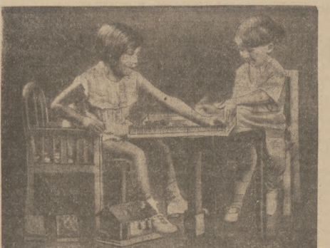
KROLEWSKIE DZIECI. Małki nastąpią tronu belgijskiego, książkę Baudouin wraz ze swą siostrzyzką Józefiną podążą załawy.