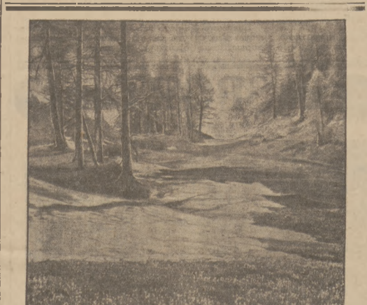
ZBIERA SIĘ WIOSNA.

Część tych bezrobotnych znajduje się w powiecie w granicach powiatu, jak budowie drogi Szczakowa-Bukowno i robotach niwelacyjnych na osiedlu w Bukowno, resztę zaś poza granicami powiatu, mianowicie w Łaganiańsku i przy robotach publicznych w Miechowskiem, a w pierwszym rzędzie przy budowie kolei Kraków - Miechów, o co, jak nam wiadomo, p. starosta Głieczyński czyni usilne starania.