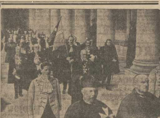
OBRAĐY ZAKONU MALTAŃSKIEGO Na raz pierwszy od 150 lat w Rzymie zebrał się kongres kawalerów maltańskich. W kon-gresie wzięli udział około 2000 rycerzy zakonu maltańskiego, który powstał w Jerozolim-zie w roku 1070.

Tak się przedstawia skomplikowany spłot zagadnień związanych z rozmowami polsko-angielskimi.