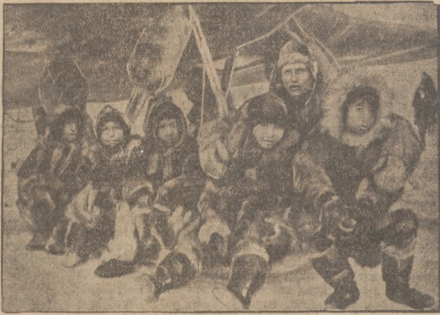
Znakomity lotnik rosyjski Babuskin na przylądku Wankarskim w otoczeniu dzieci Eskimosów.

znaniem mówią o locie Babuskina na aeroplanie, który był naprawiany kilkakrotnie w trudnych warunkach przez samego lotnika.