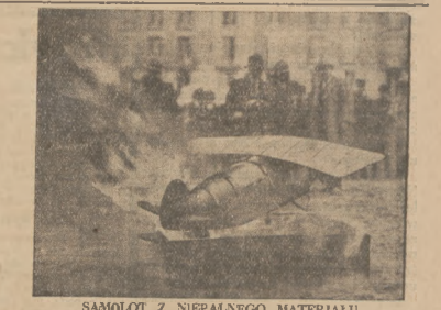
SAMOLOT Z NIEPALAŃSKIEGO MATERJAŁU. We Francji dokonano prób nowego rodzaju biplanu do powiększenia skrzydeł i kadłuba płotowca. Lekkie ten sam się nie pali i obro- ni przed podaniem drowianie części samolotu. Na zdjęciu model płotowca objęty plamie- niami w czasie prób na rybnym w Chamberet.