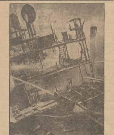
OKREŃ - CYSTERNA W PŁOMIENIACIU. W Rosnem wybuchł z niewyjaśnionych dotąd przyczyn na pokładzie parowca, wiozącego do Hawru ładunek nafty, groźny pożar. Ogień strawił doszczętnie cały statek, przy- czem dziesiątku ludzi z załogi znalazło śmierć w płomieniach.

Miasto ogłosiło upadłość. Wielkie miasto Cleveland w stanie (Cle- veland) (U.S.A.) ogłosiło upadłość. Deficyt budżetowy stanowiącego miejskiego wynosi 73 milionów dolarów; magistrat postanowił za- drukować 500 arszeków, zmniejszyć liczbę policjantów i strażaków o połowę, zapalać na ulicach tylko połowę latarni, oczyszczać ulice i placę tylko raz na miesiąc. W mie- ście panuje panika, gdyż ludność obawia się, że Cleveland stanie się w tych wa- żnych dniach jakimś „miastem” bezwy- słów. Spodziewane jest właśnie po- rządki ze strony organizacji społecznych do- rzędu federalnego w sprawie niewierdzy fi- nanowej. Cleveland należy do najbardziej zadłużonych miast w Stanach Zjednoczonych. PIĘKNE o wytwornej linji ka- jaki żądowe po bar- dzo niskich cenach wykonuje nowowlar- ta Sosnowiecka Wy- twórnia Kajaków i Parkowa (Wawel).