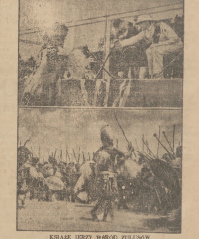
KSIAŻE JERZY WAROD ZULUSÓW. Książę Jerzy, syn króla angielskiego, bawięcy obecnie w Afryce Pałudniowej podczas pobytu w Ladysmith, przysłał się z zażenowaniem łopasem lubusiuw. U góry — naczelni i jednego z płaszków lubusich wia łopasie. Połziej — tancie Zulusów.