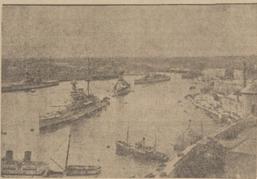
POWRÓT Z MANEWRÓW.

„Wobec powyższego, w system najmniejszego oporu i najmniejszego poczucia odpowiedzialności. Stowarzyszenie w sprawie kinowej, jak sprawa filmowa dla młodzieży, nadmiernej, nieocenionej, należy zakaz, bez żadnej egzekucyjności, musi doprowadzić do parady intencji u...”