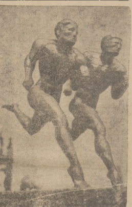
Na jednym z etapów powoj. sportowych Berli- na stanie pierwszy pamiłk Sprintera dwu- mł. Ledera.