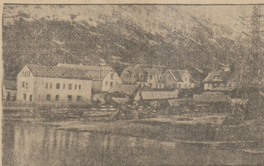
KATASTROFALNY WYLEW FIORDU W NORWEGII Zalazeni wylewem fiordu woska Talford obok Alesund w Norwegii. Wylew ten spowodował zniszczenie 600 domów i obrzyznal skaly. W katastrofie zginelo 40 osob.