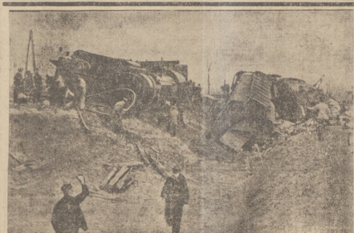
ZAMACH NA POCIĄG KOŁO LINCU.

Według dotychczas przeprowadzonego dochodzenia, sprawców było dwóch. Wkutek ciemności, rysów ich Barczykowa roznać nie mogła.