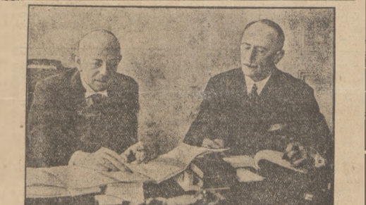
PRZED OGŁOSZENIEM NOWEJ KONSTITUCJI W AUSTRJI.

Jak się nietylko zorientować są towarzysze w tej sprawie zamierzają, w stadium realizacji znajdują się bowiem prace, które w większym stopniu do likwidacji bezrobocia się nie przyczynia. Jeżeli chodzi o akcje w większym stylu, wypracować się mają dopiero plany, przy pomocy sił miejscowych. Nie wątpimy, że plany takie zostaną wypracowane, ale może na mieć wątpliwości, czy na realizację tych planów znaleźć się pieniądze. W tem wszystkim bowiem nie wiada wyrażnie, przewodniczącej linji gospodarczej, która konsekwentnie wdzierała się z możliwościami gospo darstwa kraju. Czyny to wszystko wręcznie czegoś oderwanego, wyodrębnionego, upajania się planami działania, bez możliwości ich wykonania.