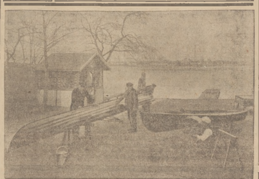
PRZED ROZPOCZĘCIEM SEZONU WIOŚLARSKIEGO. Gdy rozjadali łody i słodkie wiosenne zaczęło przygotować się na start, na rzekach i jeziorach chłopi nie nowa zryw. Wkrótce już zajął się od łodzi wiosłarskich, starannie przygotowanych i odświeżonych.

Po nabożeństwie pośród, a w godzinach południowych akademja w kinie Bajka. W rocznych punktach miasta wygłoszone zostaną krótkie okolicznościowe przemówienia o znaczeniu święta, a w lektorium czytali miejskiej w ciągu tygodnia wygłoszenia będą odpowiednio pogadanki. W godzinach popołudniowych odbędą się na stadionie miejskim imprezy sportowe, a w parku miejskim na Zielonej wsiłka zabawa ludowa.