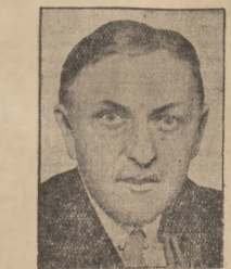
WILLIAM A. WOODIN

Przed wyjazdem do Bukaresztu min. Beck przyjeżdżył przez p. Prezydenta B. R.