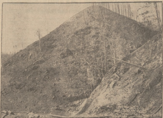
LASY PAŃSTWOWE PIŁNA POD STANISŁAWOWEM.

W lasach państwowych w Zielonej, pow. Nadworna, wybuchł pożar, niszczący lasy sosnowe. Wypalono 15 ha, zostały drzewostan, oraz około 1300 metrów sześciu drewna opałowego. Szereżem na przestrzeni 5 ha zaprzestano wszelki zagajnik, na przetrzeźni zaś 14 ha wycięto większe drzewa. Wysokość szkód na razie nie jest ustalona.