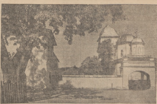
POZAR MIASTA RUMUNSKIEGO. Rumunskie miasto, Kimpolung, pałko niedawno ofiarą plonu sm. przyczem wraz z setkami domów zniszczony został stary kościół Jezu — Negro.