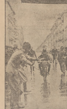
WYŚCIGI MOTOCYKLOWE MEDJOLAN — RZYM. Na tych Medjolan — Rzym odbyły się wielkie wyścigi motocyklowe, w których przeważnie miejscy zajął Terzo Bandini odlegając przed siebie z szybkością 100 km. na godzinę. Na zwycięzcę — Bandini na miejsce wyszedł w Rzymie.

Przeniesiona miejscowa w Sosnowcu bez odwołania do dnia 21.5.36. Przeniesiona miejscowa poza Sosnowcem i w Sosnowcu z odwołaniem do dnia 21.5.36.