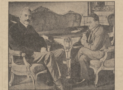
ARCYKSIĄŻE EUGENIUSZ I O KANCELERZA DOLLFUSSA.

granicznymi na rzecz sąsiadów, zwłaszcza zaś Jugosławii, o czym podobno mówił Goering w Belgradzie. Tymczasem warunki nakładają się przeciw Anschlussowi, a możliwości porozumienia francusko-włoskiego — jeszcze mniejsze. Anschluss zamieszkuje. Wszystko więc wskazuje na to, że i w Austrii, jak wogóle obecnie w Europie, wszystko pozostanie po starcie.