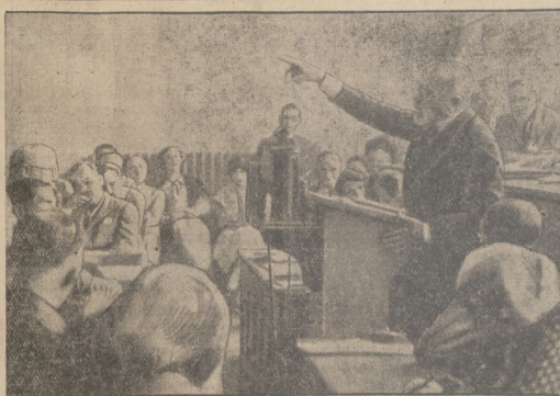
Sanacyjnie, pełne temperamentu przemówienie na konferencji rozbrojenowej w Genewie wygłosił minister Barthou. Na ilustracji min. Barthou podczas wygłoszenia przemówienia