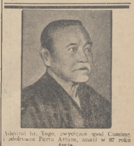
Admirał hr. Togo, zwycięzca spod Cuszima i zdobywca Portu Artura, zmarł w 87 roku życia.

W dziedzinie gospodarczej zapadł na tem zebraniu szereg uchwał, będących postulatami pod adresem rządu. Na pierwszy plan wysuwa się tutaj postulat bezwzględnego zrównoważenia budżetu, droga najważniejszą oszczędności i przystosowania ciężarów publicznych do sił płatniczych społeczeństwa. Następnie konserwatyści domagają się odbudowy rezerw, upłynnienia i obciążenia rynku kredytowego, co wiąże się ściśle z uwolnieniem Banku Polskiego od nadmiernego dyskontowania weksli przedsiębiorstw państwowych. Dalej następujący postulat: zasadniczej reformy systemu podatkowego oraz zmniejszenia ciężarów socjalnych, za niechania wszelkich planów inwestycyjnych, finansowych z wewnątrz innych środków pieniężnych, wstrzymanie bezpośredniego angażowania się państwa w poszczególne dziedziny gospodarki w charakterze przedsiębiorcy, obniżenia cen artykułów monopolowych i taryf kolejowych, a wreszcie oddłużenia rolnictwa pod kątem widzenia jego możliwości płatniczych.