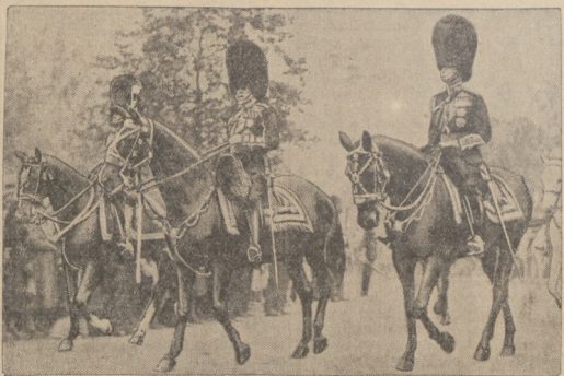
URODZINY KRÓLA ANGIELSKIEGO.

polsko-niemieckich, dodając im niezdolnej szczerości. Gdyby wizyta p. Goebbelsa w Polsce przyniosła taki efekt, wówczas znaczenie jej byłoby dodatnie.