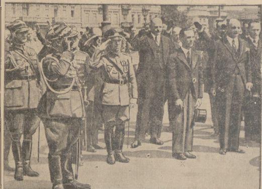
Minister Rzezy Goebbels (x) przed probem Niemiecmu Żolnierza w Warszawie, po zbrodni wietos.