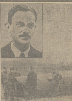
PRZYGOTOWANIA DO LOTU W STRATOSFERE. Białeński i Sosny, którzy są asistent prof. Dońca, przygotowują się do nowego lotu w stratosferze. Na zdjęciu czterech biotom budowlanego pod Krakukiem, który ma być zastawiony poraz pierwszy do lotów na wysokość. Dotychczasowe balony stratosferyczne były podważone ofiarcom kłom.

× KRADZIEŻ PIERZA. Onegdajszą nocą na szkole Piotra Onajdy w Piłicy, nieznanymi sprawcy ukradli 100 fant, pióra, 5 pudełek i 4 książki, ogólnej wartości około 300 zł.