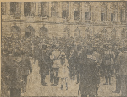
PRZED PIĘTNAŚCIU LATY.

W dniu 26 czerwca przypada piętnastka rocznicy podpisania Traktatu Wersalskiego. Oto zdjęcie, wykonane przed piętnastką laty, przedstawiające tłumy zebranych przed pałacem w Wersalu w dniu podpisania traktatu. W roku bieżącym 15 rocznica podpisania Traktatu Wersalskiego przebiegała niemal bez echa w prasie światowej.