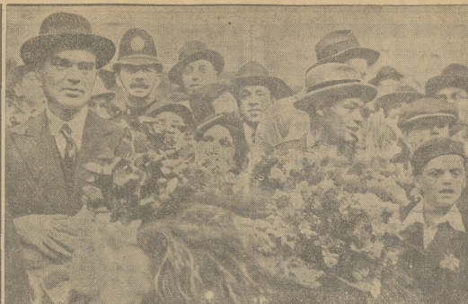
WIZYTA SOWIECKICH LOTNIKÓW W ANGLIJ.

Centralny wydział palestyński w Warszawie otrzymał zawiadomienie od Agencji żydowskiej w Jerozolimie, że rząd palestyński udzielił pozwolenia władzom żyd. do Palestyny dla narzeczonych żydowskich Palestyny. Dotychczas zarejestrowało się w agencji żyd. około 9000 młodych żydów, zamieszkałych w Palestynie, reflektujących na przyjazd narzeczonych z Polski. W najbliższych dniach centralny wydział palestyński otrzyma kilkadziesiąt pozwoleni wjazdu dla emigrantów, które są nadane w charakterze narzeczonych. Dalesze pozwolenia będą wydawane w miarę zapotrzebowania.