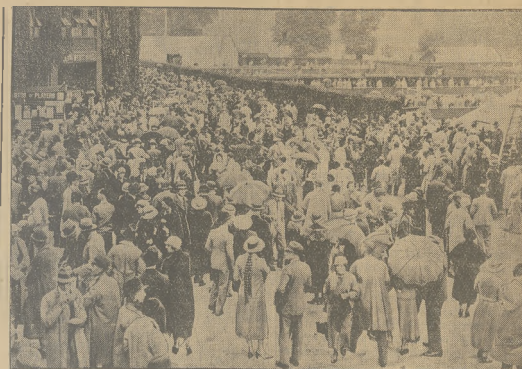
NA KORTACH WIMBLEDONU.

zagraniczne, nowoczesne, mało używane, sprzedam za bezcen. Królewska Huta, Gimnazjalna 8, magazyn mebli.