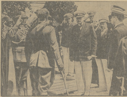
"SWI. IO MORZA" W GDYNI.

Komuniści urządzili kilka zasadzki na patrol policyjny w wąskich uliczkach dzielnicy Jordana. Na niektórych uliczkach bójki zostały przerwane przed południem. Robotnicy usiłowali podpalić jeden z mostów portowych. Przybyła na miejsce straż ogniowa, która przy pomocy sikawki zmyła z mostu rozlaną tam naftę.