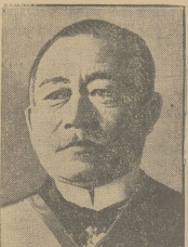
Admiral Katośka Okada nowy premier Japoniki.

TOKJO, 6.7. (PAT). Nowy rząd, do którego czele stanął Keisuke Okada z Japoniki nie ulegnie żadnemu zmianie. Hirota pozostaje nadal ministrem spraw zagranicznych. W skład nowego rządu weszli również dwaj inni członkowie gabinetu Saito: admiral Onmi, który został ministrem marynarki i gen. Hatajasi, który jest nadal ministrem wojny. Także ministrem finansów objął Masonbu Fudzi. Ministrem sprawiedliwości jest Naczei Obara.