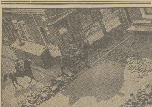
KRWAWIE WALKI NA ULICACH AMSTERDAMU.

To też wiadomości o powiększeniu zatrudnienia trzeba brać ostrożnie i nie tworzyć sobie przedewszystkiem złudzeń. Pamiętajmy, że 1931 r. był już okresem głębokiego kryzysu.