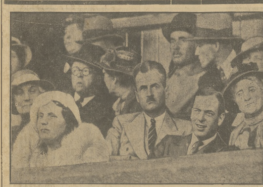
KRÓLEWSCY WIDZOWIE W WIMBLEDONIE. Księżniczka Juljana Holenderska (z lewej) i syn króla angielski czołowiek Jerzy z zainteresowaniem śledzą przebieg rozgrywek w wimbledonskich mistrzostwach tenisowych świata w Wimbledonie.