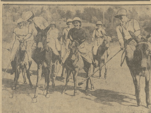
GRA W POŁO NA MULACH.

— Został! — stróżkę go mamo. — Co robił? — dziadzi. — Zaczynał mazać jego żyzik od kamizelki.