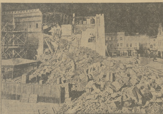
ZAWALONA WIEŻA RATUSZOWA.

W Ogniel zawałowa się wiekta wieża ratuszowa. Na fotografii widok gruzow wieży, pod którejam znajdują się prawdopodobnie liwne ofiary w łóżkach. Zającie z zostało dokonanie w nocy, zaraz po katastrofie.