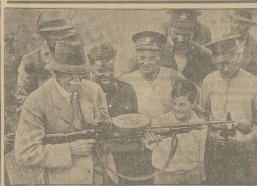
NOWA BRÓW SZKIBOSTRZELENA. Działalność angielski Panahon przedstawia skonstruowany przez siebie atomowy wystrzałowy szybkostrzelny karabin, mogący w ciągu jednej minuty oddać 100 strzałów.

12 — również pomyslna, bardzo po myślna cyfra. Poprostu — cyfra szczęściarzy, którym się wszystko udało i powie dzie.