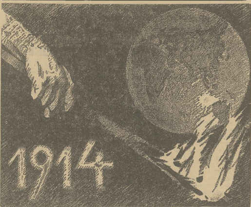
PRZED 20 LATY ROZPĘTAŁA SIĘ ZAWIERUCHA WOJENNA.