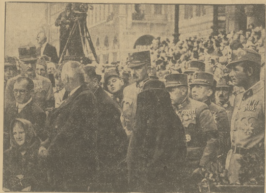
Z POGREBU KANCLERZA DOLLFUSSA. Stoja (od lewej): matka zmarłego kanclerza (ciężko), jego ojciec, wdowa i (z prawej strony) ksi. Starobemberg.