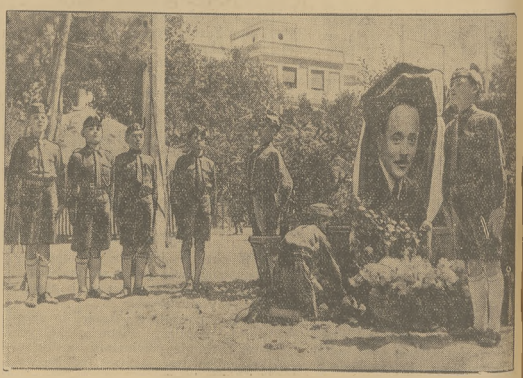
WIENIE POD PORTRETEM KANCLERZA. Odsławił „jungwatsler” z Wiednia poszające w Równiu na zaproszenie Mussoliniego, odsłaniając część zmarłego kanclerza Dollfussowi, stojące jego portret świątlny.

PROSZKI „KOWALSKINA” STOSUJE SIĘ PRZY OPORCZYWYCH BOLACH GŁOWY KONIECZNIE ZE ZNAKIEM SIECIE W BIEGOSZCIE PABRYKA CHEM-FABRYK „KOWALSKINA” W BIEGOSZCIE