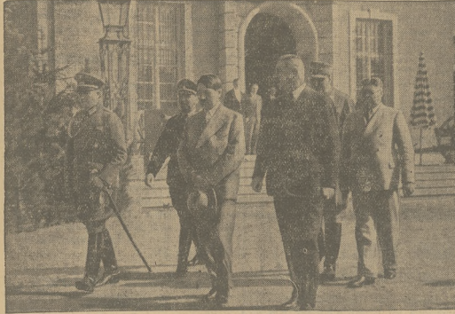
Kancelarz Hitlera wraca od łóżka umierającego Hindenburga na zamku w Neudeck. W środku Hitler, z lewej paki Hindenburg, syn zmarłego prezydenta.