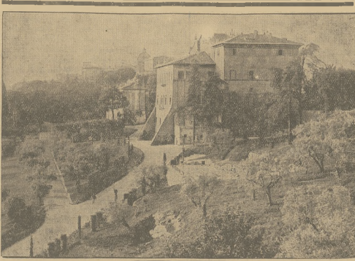
GASTIEL GANDOLFO głzie w tym roku Oficjo sw. awęza letnie mieszka.

Wiadołności te będą się mogły przyczynić niezar do sprośowania takich czy innych mylnych informacyj o naszym kraju. Okaz tego ważnym będzie wzmocnienie żywiołów polskich za granicami, żywiołów stanowiących taką ważną w naszym budowie narodowym pozycję. Ze zaś Zjazd do takiego wzmożenia i do konsolidacji poczyni tych żywiołów wale nie przyczyni — co do tego nie może być wątpliwości. Społeczeństwo krajowe odniesie ze Zjazdu podwójną korzyść: będzie miało sposobność zełknięcia się z zagranicznymi rodakami, a pozostał pozna ono wartość tych rodaków, przekona się, że ich popieranie leży w jego własnym interesie.