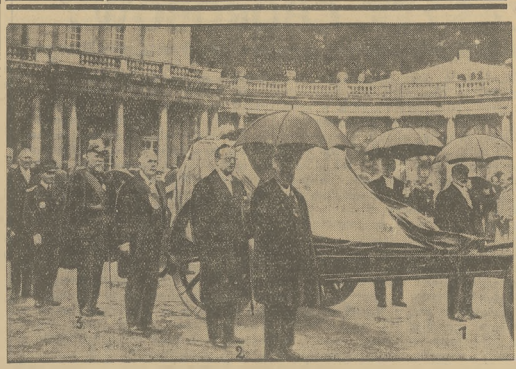
Pogrzeb marsz. Lytwyca. Za trumną koczują między innymi: młn. Barthou (4), Tar-dien (2) i gen. Gouraud (3).

Żyjemy głębokim przekonaniem, że powstający obecnie Światowy Związek Polaków Zagranicą, tylko wtedy będzie mógł skutecznie spełniać swe zadania, jeśli będzie miał charakter ścisłej ponadpartyjny, jeśli będzie zrzeszał w swem łonie na równych prawach wszystkich Polaków i wszystkie organizacje polskie zagranicą, stojące na gruncie wspólnoty z matczyną.