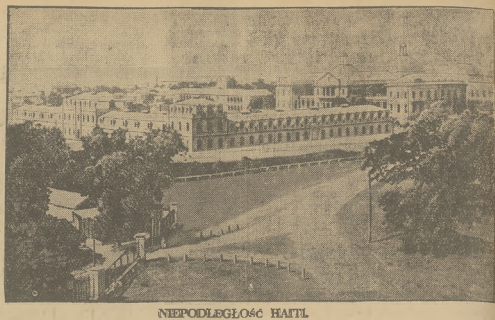
NEPODLEGŁOŚĆ HATLI. Republika Hańi otrzymała niepodległość od 1 sierpnia. Na ilustracji smacchy rządowej w stolicy republiki.