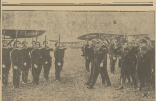
Sowiecka eskadra lotnicza zbliża się do polskiego lotniska francuskiego. Ilustracja przedstawia moment wyładowania eskadry na lotnisku Le Bourget.

Sądymy, że rząd nasz będzie musiał porzucić ten jednostronny, budżetowy stosunek do zagadnienia podatkowego. Zmusi go do tego dalszy rozwój, życia gospodarczego, a także głębsza troska o zapewnienie budżetowi trwałej równowagi. Chodzi jednak o to, aby ta zmiana poglądów nie przyniosła katastroficznych skutków. Nie można postawić tej sprawy (tak, że podatki zostaną niekierne, a życie gospodarcze otrzyma ulgę w postaci zmniejszenia opłat ubezpieczeniowych. Takie bowiem rozstrzygnięcie byłoby jednocześnie rozstrzygnięciem sprawy obciążenia publicznych nie przynosząc istotnej poprawy losu drobnym i średnim warsztatom pracy.