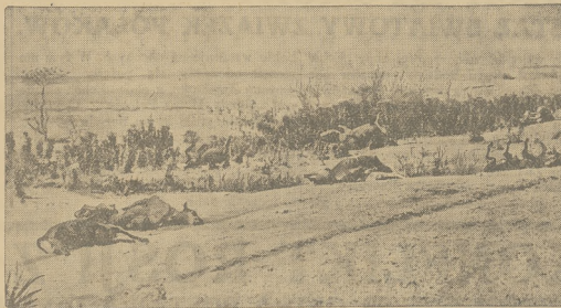
W Stanach Zjednoczonych spowodu upałów było pada masowo.

niezdzielny spędza w kłobowisku ludzkim w halasie nawoływaj, śmiechów i okrzyków, który zgłuszają szum morza. Ale Nowojorczycy, powracający w niedzielę wieczorem swym autem, które stanowią tylko male ogniewo w obrzamyim lańcuchu innych aut, jest zupełnie zakłopotany. Gaczy podają najeźrzyt koloralne cyfry wycieczkowiczów na plażach a wysoki cyfry budzą szumek w każdym Nowojorczyku.