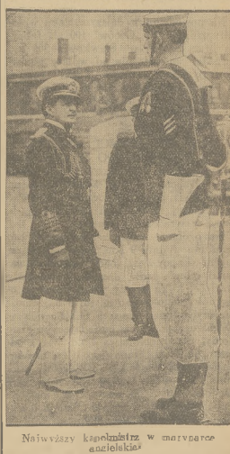
Najwyższy kapelmistrz w marynarce żeglarskiej

Dalej Aeroklub ofiarowuje 5 biletów na trybuny podczas zawodów Challenge i Gordon-Bennett, wreszcie cały szereg książek, a mianowicie: 2 egzemplarze wydawnictwa „5 lat Lotnictwa Sportowego w Polsce”, 2 egzemplarze książki „Żwirko i Wierus z lotniska RWD”, 2 egzemplarze książki majora Skrzyżniaka „Na RWD-5 przez Atlantyk”, 2 egzemplarze książki Bolesława i Józefa Adamowiczów „Przez Atlantyk”.