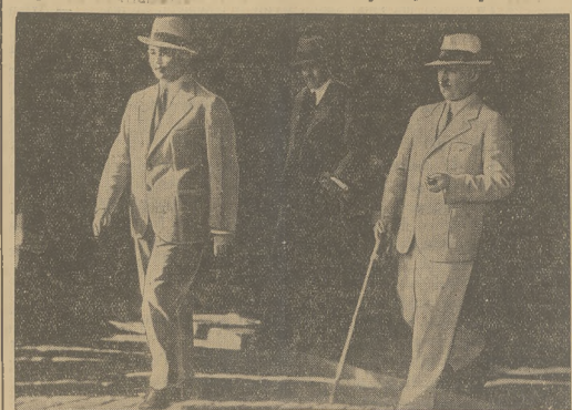
Otto Habsburg (z lewej), pretendent do tronu cesarskiego w towarzystwie dwóch przedstawicieli arystokracji baw. w Szwajc. udzie siarza się o rękę jednej z księżniczek.

W rozmowach Mussoliniego ze Starhemborgiem opowinono oświadczyć kwestje reorganizacji policji austriackiej i Heimwehry, która ma być zorganizowana na wzór milicji faszystowskiej.