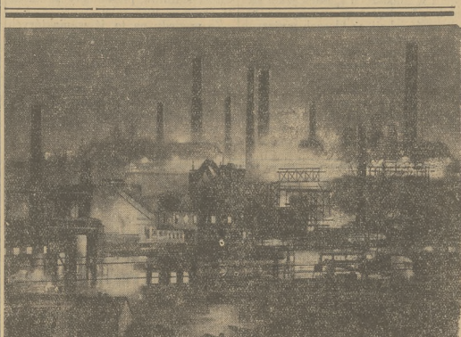
NOC W OKRĘGU PRZEMYSŁOWYM.

Pracodawcy, organizując pomoc chorobową dla swoich pracowników, nie ponoszą żadnych wydatków administracyjnych, nie doznają żadnych strat na skutek symulacji. Lwowi oni przeznacza zlotówkę na pomoc chorobową dla swego pracownika, to cała ta zlotówka zmienia się w honorarium lekarskie, lekasarska, koszt szpitalny i ani jeden grosz nie idzie na rzecz, nie mając nic wspólnego z chorobą pracownika. Tymczasem, gdy ubezpieczalnia społeczna przeznacza zlotówkę na ten sam