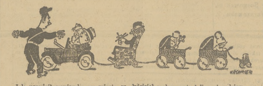
Jak strażnicy wycieczki za miastem w ilościach małego asna i licznej rodziny.