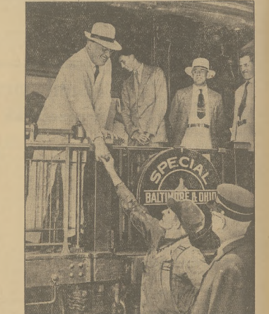
PREZYDENT I MASZYNIŚTA. Prezydent Roosevelt, kończąc swą podróż wypryżkową, żegna się z dworcem w Waszyngtonie, w momencie, którym odbył ostatni etap swej podróży.