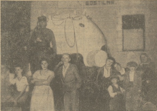
PO SZCZĘŚLIWYM LOCIE DO STRATOSFERY.