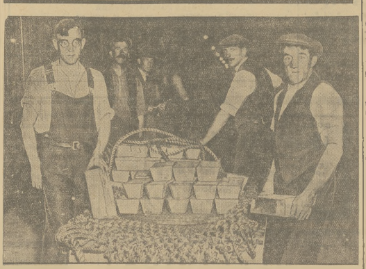
NAJWIĘKSZY TRANSPORT SREBRA PŁYNIE PRZEZ ATLANTYK. Parowiec „Wasygaton” przejeżdża do historii jako ten okręt, na którym przetapiano w Ameryki największą w dziejach świata ilość srebra, składającą się z 40,000 stów. Oto jak wygląda ładowanie srebra na okręt w porcie Southampton.

stację lotniczą dla samolotów, przebiegających nad południowym Atlantykiem. Stwierdzi się więc w tym punkcie strategicznym. Anglja wie, jak ważna jest ta wyspa i dlatego nie zabraknie jej mieszkańcy. Obecnie projektowane jest nawet jednonozne połączenie okrętowe Anglii z wyspą.