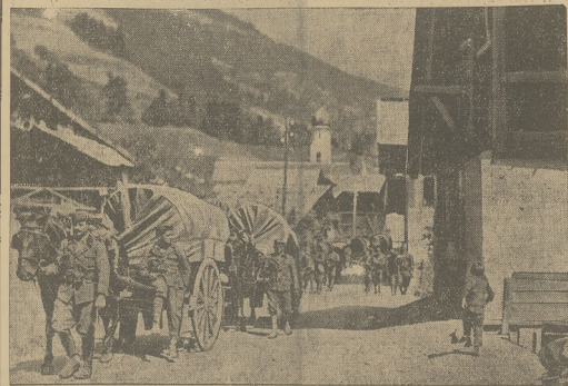
Powrót wojsk włoskich z nad granicy Austrii, gdzie zgromadzone są w związku z puczem hitlerowskim.

zgodziliśmy mu we Włoszech i za zrozumienie Austrii, wykazane przez opinię publiczną i prasa włoską, zwłaszcza w ostatnich momentach.