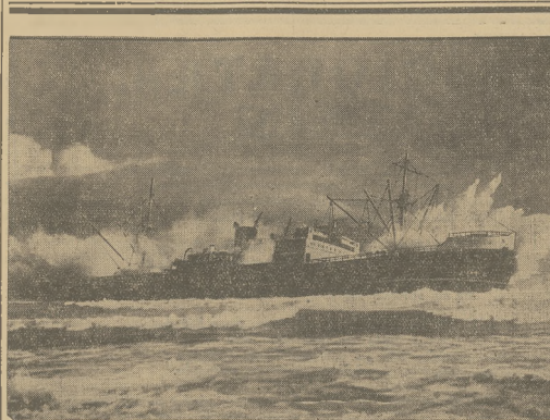
Na okręcie angielskim „Winton” u brzozy południowej Afryki wybuchł pożar, który w ciągu kilku dni zniszczył cały okręt.

żach katolickich. „Matin” również uważa, że popularność Hitlera w masach osłabia. Podobnie piszą „Echo de Paris” i „Figaro”. Także prasa angielska, która w ostatnim czasie w sposób niezmiernie szorstko występowała przeciw reżimowi Hitlera, podnosi słabo strony „zwycięstwa” niedzielnego i daje wyraz swej awersji dla rządów dyktatorskiej w Niemczech, podkreślając, iż Hitler jest dziś panem ziemi i śmierci 65 milionów ludzi w całym centrum Europy.