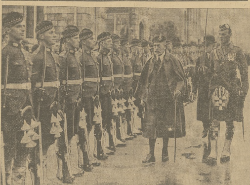
Król angielski Jerzy w narodowym stroju zaskończył przed frontem oddziału gwardii szcok kiej.