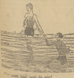
Coś więcej niż tylko do siebie

Obecnie kilkanaście parowozów — jest u nas dwa razy więcej aniżeli w Niemczech t. j. zwiększył się do takich rozmiarów, jakie miały miejsce a mogły być wykorzystane jedynie tylko w okresie