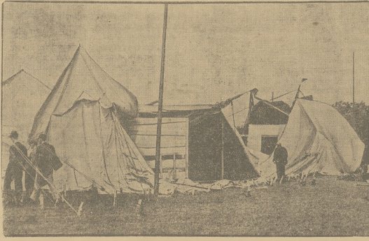
ORKAN NAD ANGLIĄ. Angielskie miasto Southampton nawiedziła ostatnio niezwykłej siły trąba powietrzna, niszcząca domostwa, pawilony i namioty, w kil-ygodniach medycy się eksponaty międzynarodowej wystawy ogrodniczej.

Szwedzka komisja dla spraw bezrobotnych opracowała plan zatrudnienia bezrobotnych młodzieży, który przewiduje dostarczenie pracy 15 000 młodym bezrobotnym. Komisja ta składała w ostatnim swym sprawozdaniu, iż liczba bezrobotnych wśród robotników szwedzkiej, a zwłaszcza wśród młodzieży, spadała ostatnio bardzo znacznie. Plan zatrudnienia bezrobotnych obejmuje m. in. budowę specjalnych dróg dla wykończenia wzdłuż zniechęcającej już teraz wykończonych. Według ostatnich danych bowiem liczba cyklistów w Szwecji wzrosła bardzo powoli i obecnie znajduje się w użyciu o 60 proc. więcej rowerów niż przed dwoma laty. Bezrobotni mają się zająć ponadto kopaniem rowów w miejscowościach letnisk, celem zapobieżenia rozszerzeniu się ognia w czasie powodzi letni, która to praca wyrażoną corocznie znaczne szkodły. Poza tem duża ich ilość znajduje pracę w obozach, gdzie pracodawcy przysposobili naukowo i praktycznie, jak i praktycznie w dziedzinie rzemiosła.