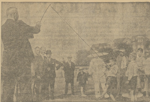
KATAPULTA DO WYZUCZANIA MODELI LATAJĄCYCH. W Rotterdamie wypróbowano działanie katapulty gumowej do wyznieszenia z wielką szybkością pomalowaną model latających. Rzeczy swej zręczności siatnika, wyzwał model udaje się znakomicie.

Nie dźw też, że nieki prawie nie mają tablicy przed dworcem bez zwrócenia na nią uwagi i że Challenge jest najważniejszym wypadkiem dnia.