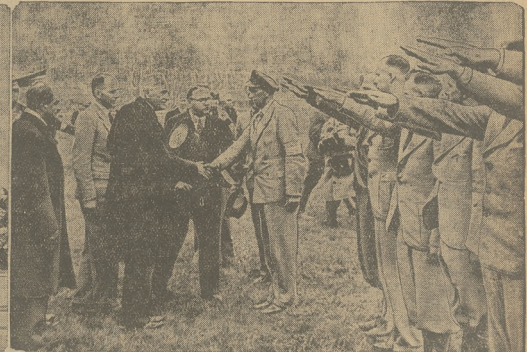
Na lewo: otwarcie turnieju przez p. Prezydenta; na prawo: p. Prezydent wita się z zawodnikami.

RZYM, 30.8. Prasa poświęca obszernie artykuły międzynarodowemu turniejowi lotniczemu.