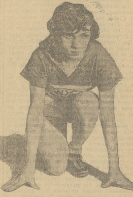
STELLA WALASIEWICZÓWNA rekordzistka światowa w biegu na 100 m. (14,7sek.)

młodzieży w latach 20 — 29. Tem objaw, co prawdopodobnie rezultat panującej się gruźlicy dobywającego w tych granicach wieku najwięcej ofiar.