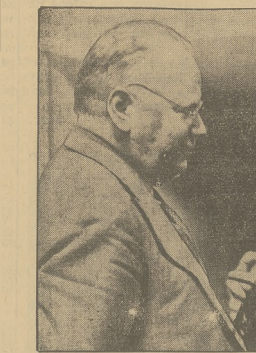
DNI GENIEWSKIE. Minister Barthou konferuje z komisarzem spraw zagranicznych Z. S. R. R. Litwinowem

kie dotad dawala Polska, wymaga w miarę wzrostu sil niemieckich odpowiadajacych wzmożeniu sytuacji na wschodzie — przez współdziałanie z Polską i Francją Rosji. W Warszawie jednak obawiają się, że Francji chodzi nie tyle o współdziałania Rosji z Polską i Francją, ile o zastępienie w tej konstelacji Polski — przez