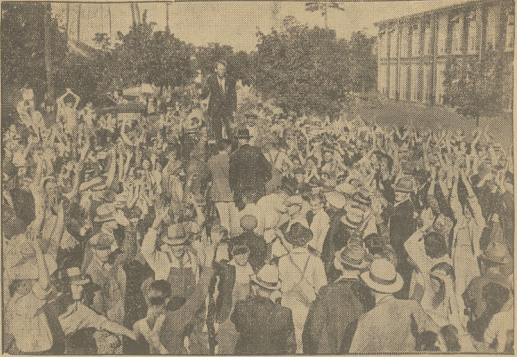
Agiator przemawia do tłumu tobatników włókienniczych, wzywając ich do strajku.