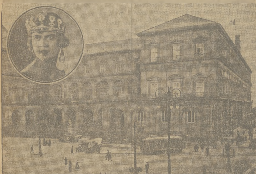
PAŁAC KRÓLEWSKI W NEAPOLU gdzie przyjdzie na świat potomek ks. Humberta. W owalu księżca Marja Jose.