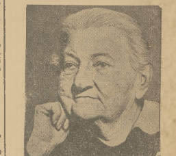
W Czechosłowacji zmarła w 90 roku życia (babka rębowała) nosyjskie Breszko-Breszkowice, czeska pani sekretarza B.B. wia na Szwecję, gdzie spędziła 50 lat.

Ujawiano już w znaczeniu, że w rejestr spraw i sprawek dziesiątki sanacyjnej. Dorzeczony do nich sprawę pos. Ostieńskiego, generalnego sekretarza B.B. Moje i ja zainteresować się „Komisja sanacyjna” w Klubie B.B.