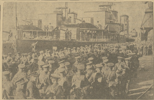
Manewry angielskie w pobliżu Hnli. Piechota zaskaradowuje się na okręt wojenny.