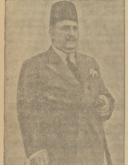
KRÓL EGIPSKI FUAD poważnie zachorował.

Ze względu na toczące się śledztwo, bliższe szczegóły ołbrzymiej sfery nie mogą być jeszcze ujawnione. Aresztowanie barona Nélkena nastąpiło na podstawie art. 262 k. k. tj. za przywłaszczenie. Osadzono go w więzieniu śledczym przy ul. Dziekiej, na t. zw. Pawliaku.