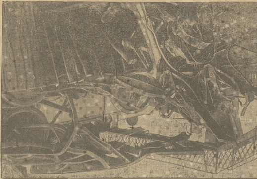
PO STRASZNEJ KATASTROFIE KOLEJOWEJ W ANGLII