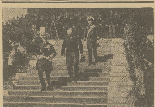
PIĘTNASTOLECIE REGENTA WĘGERSKIEGO HORTHY.

alskiego, po którym byłaby — rozumie się — otwarta droga do normalniejszych stosunków sąsiedzkich. Siaranie Niemiec zmierzających do ugodzenia partnera francuskiego. Jeżeli zaś zaistniałoby w plebiscycie francuska (tęza i zw. „status quo”, rozgniwo to znowu z trzeciej Rzeszy w Niemczech gniew na Francję w wysokiej mierze i uniemożliwiłoby zbliżenie niemiecko - francuskie.