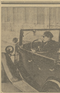
Policya partycka posługuje się samochodami, zaparkowanymi w stacje radjowe nadawców i odbiorców dzięki czemu dany usłudzek każdego czasu może się komunikować z centralą