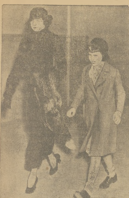
SKANDALICZNY PROCES MRS. VANDERBILT.

W Nowym Jorku toczy się obecnie proces, którego bohaterką jest dziesięcioletnia Gloria Vanderbilt, córka znanego bogacza amerykańskiego, dziedziczka milionowej fortuny. Mała Gloria znalazła się doniedawna pod opieką matki, której tryb życia wywoływał jednak pliski i uzasadnione sprzeciw rodziny Vanderbiltsów. Przed kilku miesiącami matka Glorii, Mrs. Payne Whitney uprowadziła przymocowaną dziewczynkę do domu, gdzie wychowywała się w podziemiu. Matka Glorii domaga się obecnie przed sądem oddania jej dziecka. Na zdjęciu Gloria Vanderbilt wraz z matką Payne Whitney.