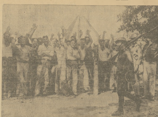
ROBOTNICZY W OBOZIE KONCENTRACYJNYM.