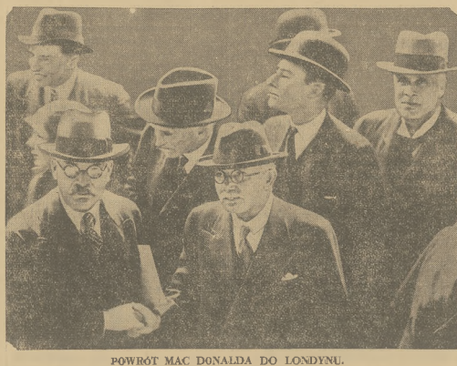
POWROT MAC DONALDA DO LONDONU.

Z drugiej strony - jak píše rzymski korespondent „Tempra” - dobrze w Rzymie wiedza o akcji nie mieć w Europie centralnej, na Węgrzech, na Balkanach, a szczególnie w Jugosławii. Rzym nie może dopuścić, aby Niemcy w stosunku do niego uprawiali dwie polityki, wzajemnie się wykluczające, jedną, która przeciwstawia się najżywym interesom Włoch i drugą, która stara się na nowo zadrażniać stosunki między naszymi dwoma krajami. Rzym zatem jest czujny, nie czyni żadnych kroków, lecz czeka. Droga dla wielkiego dzieła zbliżenia włosko - francuskiego jest całkowicie otwarta”.