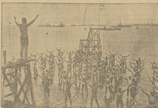
„WEEK-END” POLICJANTÓW JAPONSKICH.

Wszystkie kobiety mają dla siebie uśmiechają się.