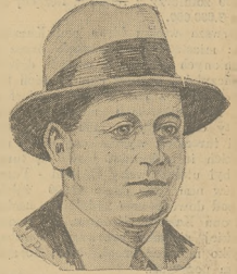
Morderca króla Piotr Kalemán.

W dniu 18 bm. odbędzie się w Keszczadzie uroczyste Requiem, potem zwłoki przeniesione zostaną do kościoła w Oplican, gdzie odbędzie się złożenie ich do mauzoleum Karadzordzowicow. W pogrzebie reprezentowane będą wszystkie oddziały wojskowe Jugosławii i ludność rywalna ze wszystkich prowincyj.