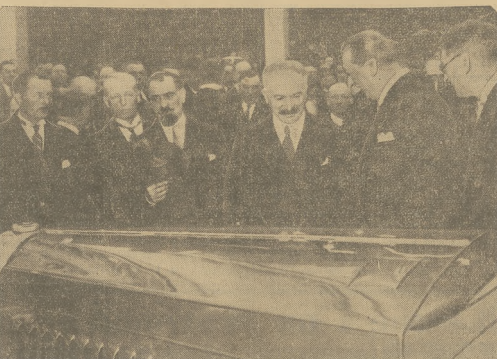
Prezydent Lebrun na otwarciu salonu samochodowego w Paryżu.

Pod tem hasłem otwarty został w Paryżu doroczny wielki salon samochodowy. Wska-zując na to auto zastawiając przywileje-lem sfer zamożnych, a staje się przedmiotem zainteresowania dla szerokiego mas konsumpcyj-nym tym kierunku i, j. w kierunku motocy-klów, czy auto lekkiego są wszelki wielkimi fabrycy. Czy auti sąspół w ostatnich czasach o 25 proc. przeliczeń, przodem też o silo 6 HP z 1954. Jest lepszy niż silnik o silo 10 HP z 1926. Należy przeto uwzględnić