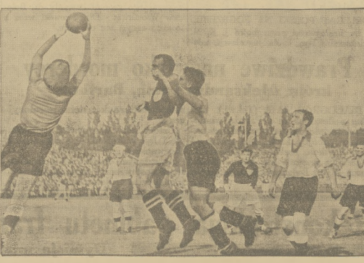
MECZY — DANJA.

W ub. niedziale odbył się w Kopenhadze mecz piłki nożnej między Niemcami a Danią, zakończony zwycięstwem drużyny niemieckiej, w stosunku 5:2 (1:0). — Na ilustracji: bramkarz niemiecki wyciąga niebezpieczną piłkę.